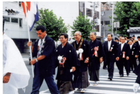
山門落慶時のお練り行列（平成6年） 左から2番目が本人