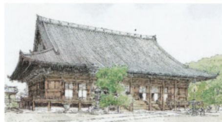
年賀状用に夫が描いた知恩院・御影堂

ワクチン接種が報じられるようになり、コロナ収束の兆しが見えだしたように感じる。法然上人の御教え「常に念仏すべし」に邁進したい。