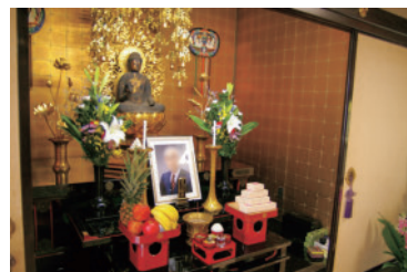
お飾りの一例です