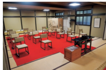
イスの間隔は調整可能です

さらにネット環境が整っていますので、Zoom などオンラインシステムを活用して、ご自宅と寺をつなげることも可能かと思えます。