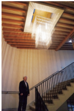
寺院では珍しいシャンデリア

こだわりの一例をあげると正面玄関から入ってすぐのシャンデリア付きの階段で天井の四角いかんじが天蓋（※てんがい）につながっています。