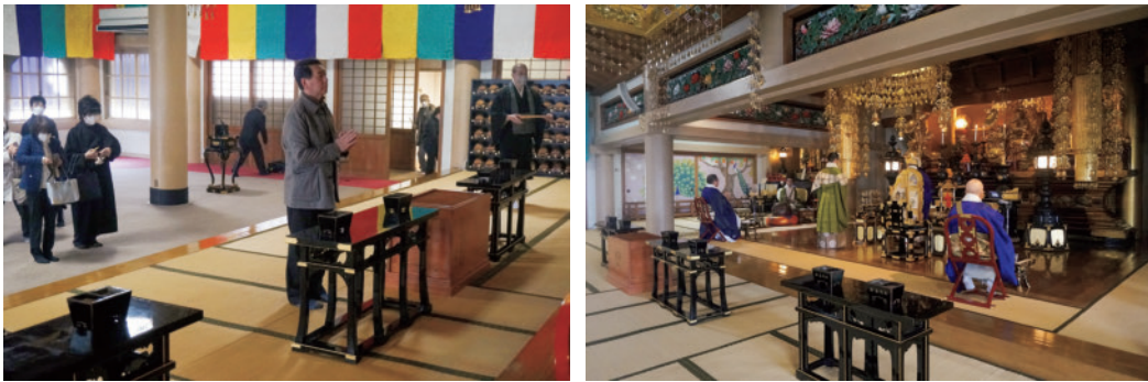
昨年の彼岸法要の様子

また、本年も YouTube での配信（各種法要・毎週日曜の朝のお勤め）などオンラインを活用していきますので、どうぞ宜しくお願いいたします。