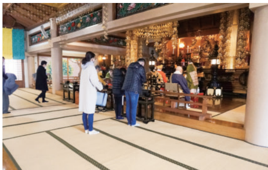
3月の春彼岸法要の様子

お問い合わせは電話またはホームページの問い合わせフォームからも受け付けております。どうぞ、よろしくお願いいたします。