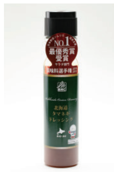
玉ねぎの旨味を詰め込んだ、しょうゆベースのドレッシング