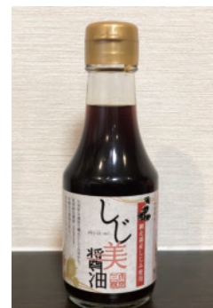
お刺身には“しじ美醤油”が合うとの声も多数とのこと（高垣店長談）