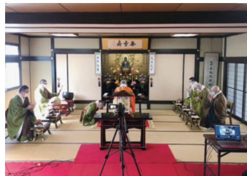
4月の灌仏会の様子