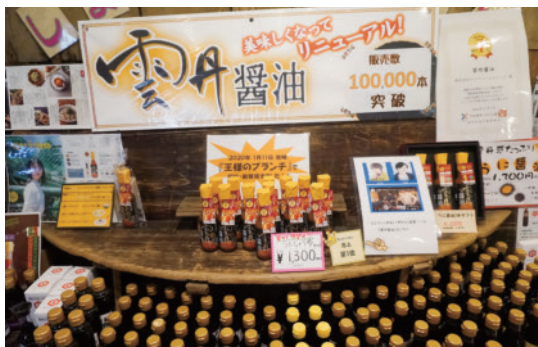
大人気の雲丹醤油は高級な雲丹をギュッと凝縮した美味しさです

“これまでも これからも”と醤油づくりの伝統を守り、挑戦しつづける姿勢を学ばせていただいた取材となりました。