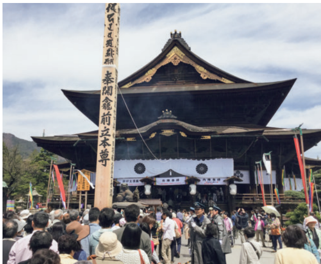
回向柱と本堂（白い糸が“善の綱”）

善光寺の歴史は大変古く約1400年前にさかのぼり、創建後まもなくご本尊は自ら秘仏になられたと伝えられています。以来、絶対秘仏として、善光寺のご住職たちでさえも、そのお姿を見ることはできません。数え年7年に一度の御開帳では前立本尊さま（絶対秘仏のご分身とされている）がお姿を現してくださいます。一つの光背に阿弥陀如来さまと観音・勢至のお三方がおられるため一光三尊仏とお呼びしています。