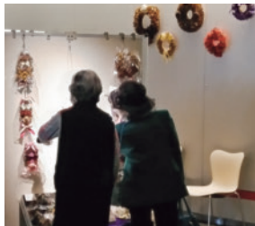
チカホでのリース展

加齢に伴い、仏事の参列が増えた。昨年末には主人の実弟、従兄弟を見送った。明けて4月、2日には親友Kさんの次男の訃報に接した。すでに長男を亡くした彼女に掛ける言葉がない。3日、私の従姉妹の急死だ。温泉の入浴死だった。4日には義兄の逝去だ。残された姉が心配で日参している。最後には「楽」だ。4月25日と26日