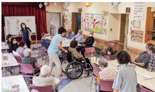
デイサービスの光景

に高齢者人口並びに認知症高齢者の増加などが予測されており、当施設でも「和顔愛語 わげんあいご で利用者様それぞれの当たり前の生活に寄り添うケア」を目指し、地域の皆様に安心して選んでいただけるようより一層取り組んでまいります。