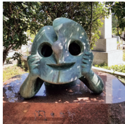
岡本太郎氏の墓碑