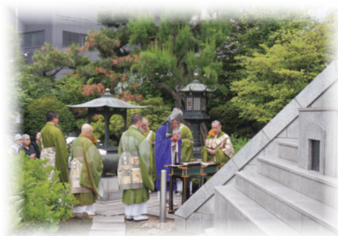
合葬墓前での法要