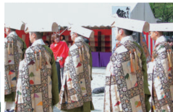
増上寺御忌大会のお練り行列