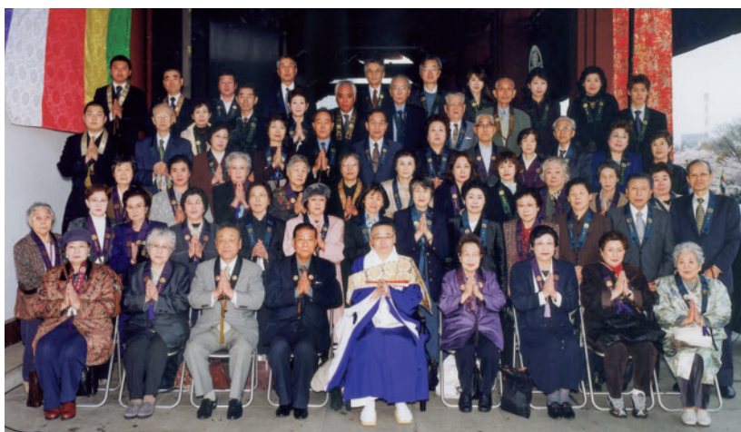
増上寺団体参拝集合写真 (2003年4月)